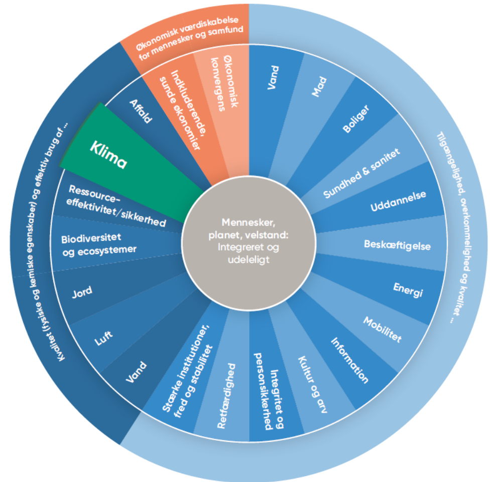
Figur 1: UNEP FI impact radar

I 2021 valgte vi at arbejde videre med klima som et væsentligt negativt impact-område, idet Spar Nords kerneaktiviteter bl.a. vedrører finansiering af biler, ejerboliger, lejeboliger, landbrug og transport, der alle udleder betydelige mængder CO 2 e. Ud fra en vurdering af, at bankens hovedaktiviteter i 2022 er uændrede fra 2021, og at klima således fortsat er bankens væsentligste impact-område, har vi i denne analyse for 2022 valgt at kvalificere arbejdet med klima som impact-område. Ambitionen for kommende Impact Analyser er at udfolde og analysere flere væsentlige impact-områder.